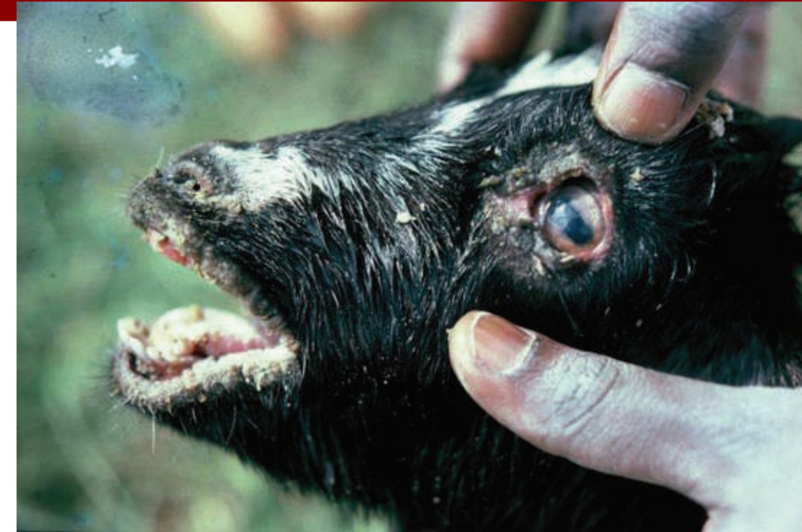
Ορώδες υγρό από τα μάτια και τη μύτη, έντονη σιελόρροια (εικόνα βρεγμένου προσώπου)