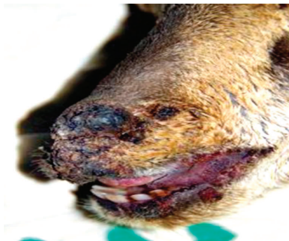
Αλλοιώσεις στο στόμα: λευκές πλάκες στα ούλα και στο εσωτερικό των χειλιών