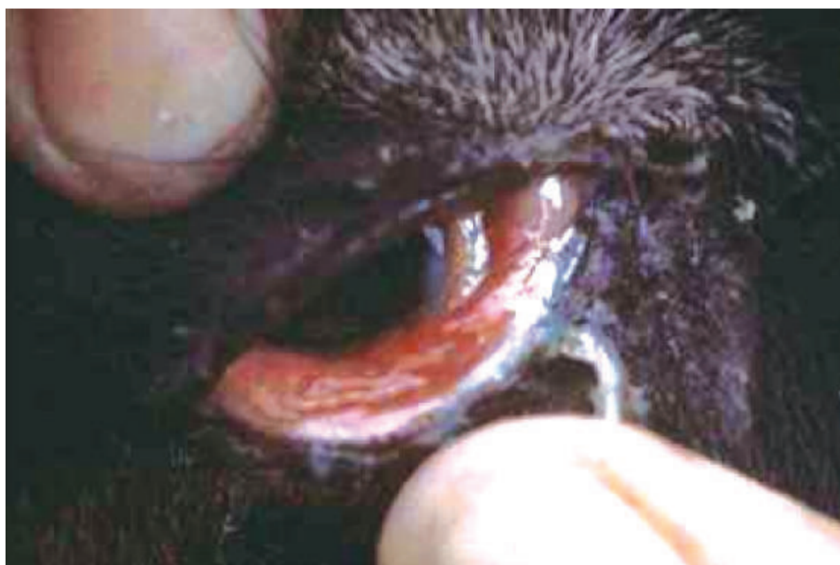
Κόκκινα, Πρησμένα μάτια